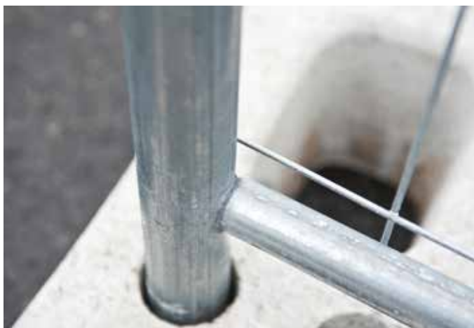
Mailles 200 x 100 mm