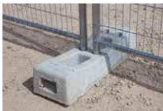
Plot béton 36 kg