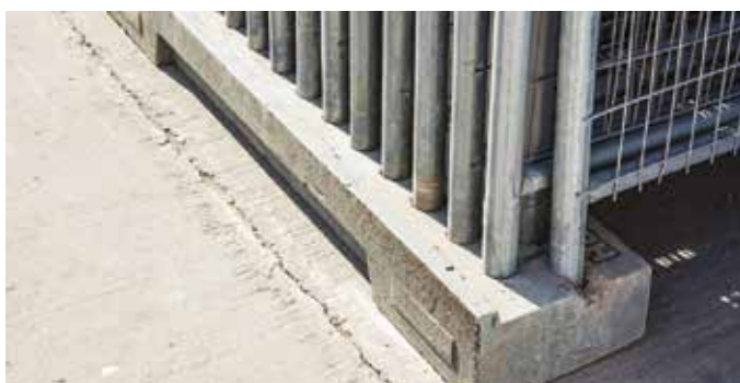
Support de rangement pour 28 clôtures