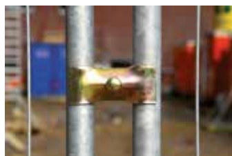
Collier - Raccord solide