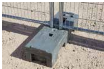
Plot PVC recyclé très résistant 20,5 kg